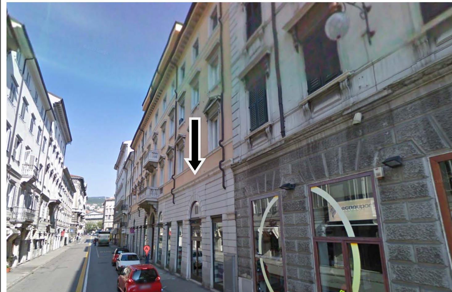
RIPRESA FOTOGRAFICA DEL FABBRICATO DA VIA IMBRIANI